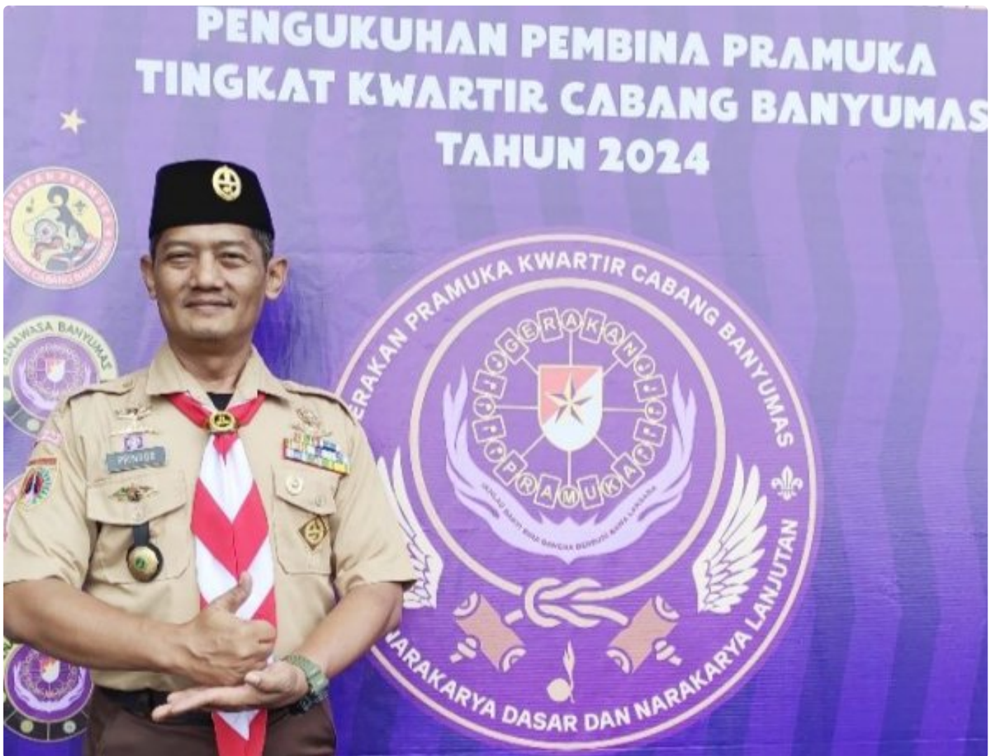
Kapenrem 071/Wijaya Kusuma dikukuhkan sebagai Pembina Pramuka Kwartcab Banyumas

BANYUMAS - Kapenrem 071/Wijaya Kusuma Kodam IV/Diponegoro, Kapten